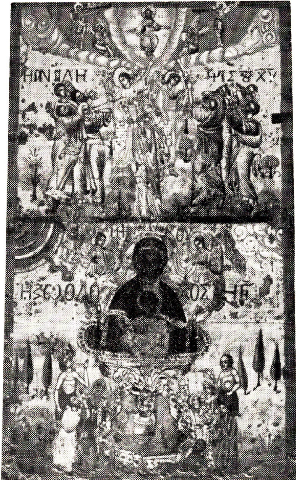
Ἡ θαυματουργὸς καὶ ἅγια Εἰκὼν τῆς Χρυσοπηγῆς Σίφνου, χωρὶς τὸ ἀργυροῦν ἐπικάλυμμα καὶ τ' ἀφιερῶματα (μετὰ τὸν γεγόμενον καθαρισμὸν - ἀναπαλαίωσιν Τῆς).