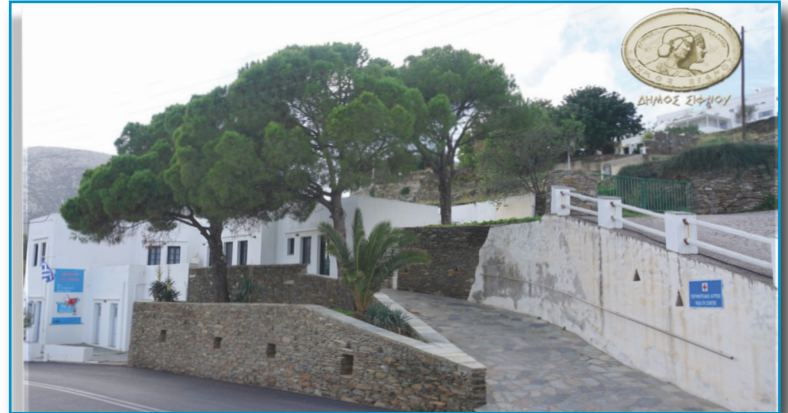
Το Ιατρείο μας! Που πάντα είχαμε την έγνοια του, το έφεραν οι ... καιροί στην επικαιρότητα. Οι άνθρωποι που το στελεχώνουν δίνουν τον καλύτερο εαυτό τους, άψογα, εκεί μέσα ολημέρη. Η καλή είδηση είναι ότι ενισχύονται με παιδιάτρο (ΕΠΙ ΤΕΛΟΥΣ!) και με οδηγό και πλήρωμα ασθενοφόρου. Και ξαφνικά μετά από πολλούς μήνες θετικής ανυπαρξίας, πλακώσανε τα κρούσματα, που και αυτά τα αντιμετωπίζουμε με όλες τις υπάρχουσες δυνάμεις τους. Ας ευχηθούμε κουράγιο και δύναμη και αντοχή!

Επίσης, ευχαριστούμε το 1ο Moto Car Rental , που ευγενικά παραχώρησε ένα αυτοκίνητο για τις μετακινήσεις του νέου επικουρικού προσωπικού του Ιατρείου μας.»