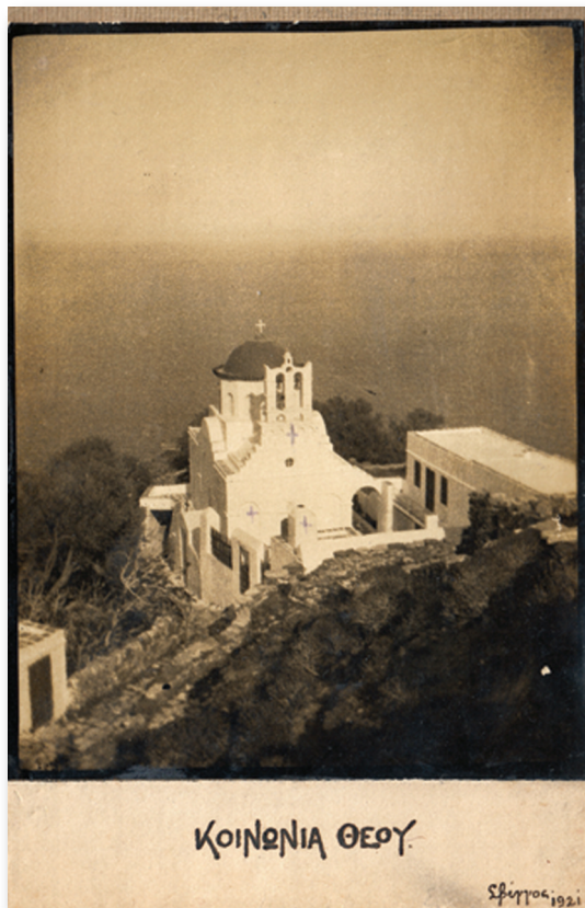
Η Παναγιά η Πουλάτη ακριβώς 100 χρόνια πριν, με το φακό του Αλκιβιάδη Λεμπέση (Σβίγγου).Στη διπλανή εικόνα δημοσιεύματα - μαρτυρίες από τον σιφνέικο τύπο της εποχής.

Λόγω της παρατεταμένης ξηρασίας - λειψυδρίας και προβλημάτων που παρουσιάζονται στο δίκτυο, διαπιστώνεται έλλειψη νερού, φαινόμενο που θα οξυνθεί το επόμενο διάστημα λόγω αύξησης του πληθυσμού και των χρήσεων. Ας συμβάλουμε όλοι στην αντιμετώπιση του προβλήματος με την προσωπική μας συμβολή στην οικονομία στο νερό!