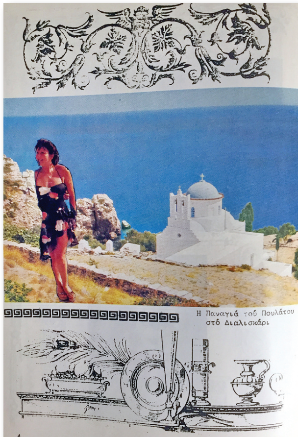
Ημερολόγιο της Αδελφότητας Σιφνίων του 1988.

Κατά την ταπεινή μας άποψη, όπως διαμορφώθηκε μετά από ενδελεχή έρευνα στα ιστορικά αρχεία της Σίφνου (ή τουλάχιστον σε αυτά που είναι προσβάσιμα), η εκδοχή περί Κεφαλλονίτη «Πουλάτου» πάσχει. Αν και τα Πουλάτα της Κεφαλονιάς (Σύμη) είναι παλαιό φράγκικο και γνωστό τοπωνύμιο, εν τούτοις το όνομα «Πουλάτος» σπανίζει. Ίσως βέβαια στην Σίφνο να έγινε παρασούκλι δηλωτικό καταγωγής. Ομως, οι κατά καιρούς ιστορικοί ερευνητές δεν ανευρίσκουν ουδεμία σχετική γραπτή αναφορά για ένα τέτοιο πρόσωπο και ούτε τολ-